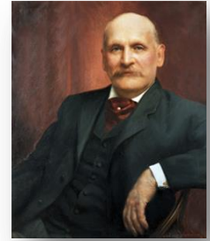
William Wallace Cargill ผู้ก่อตั้ง